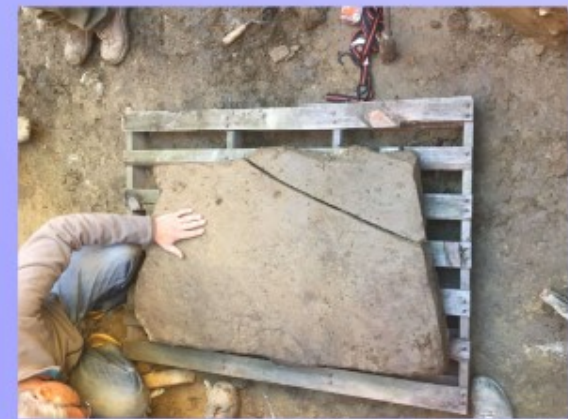
Corso Divisione Acqui novembre 2016